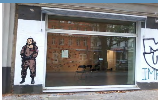
Exteriör Errant Bodies, Kollwitzstrasse 97, Berlin

Begreppet uppstod under det berömda "State of the World Forum" som hölls på San Francisco's Fairmont Hotel år 1995. Den här idén presenterades som lösningen på förverkligandet av det "20/80-samhälle" man ville uppnå under 2000-talet.