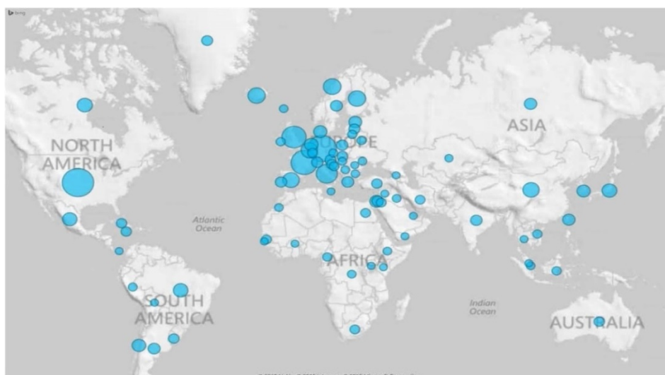
Figur 1. Karta över spridningen av svenska konstnärers resor med Konstnärnsnämndens stöd till internationellt kulturutbyte och resebidrag under 2014.

Inom stipendieformerna internationellt kulturutbyte och resebidrag har 736 konstnärer redovisat sin resa. Av kartan framgår att resor till och utbyten inom Europa är det vanligaste, följt av Nordamerika, men resor till resten av världen stod för 27 % av allt resestöd.